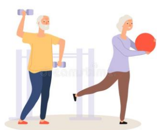
Exerciții fizice sau sport