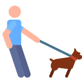
Plimbatul animalelor animalelor de companie