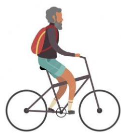
Mers cu bicicleta